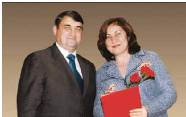
О.В. СТАРЫХ С МИНИСТРОМ ТРАНСПОРТА РОССИЙСКОЙ ФЕДЕРАЦИИ И.Е. ЛЕВИТИНЫМ

ческим центром, согласовывается с Федеральной службой по надзору в сфере транспорта и утверждается Федеральным агентством железнодорожного транспорта.